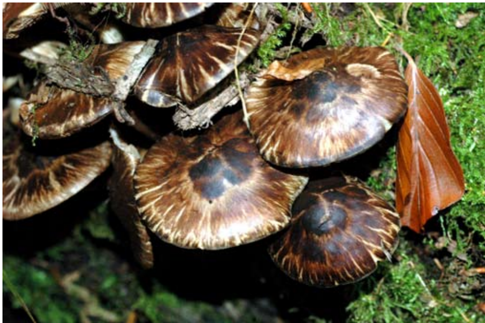
Fot.1. Owocniki kruchaweczki plamistej Psathyrella maculata, rezerwat przyrody „Zamkowa Góra”, 11.10.2008