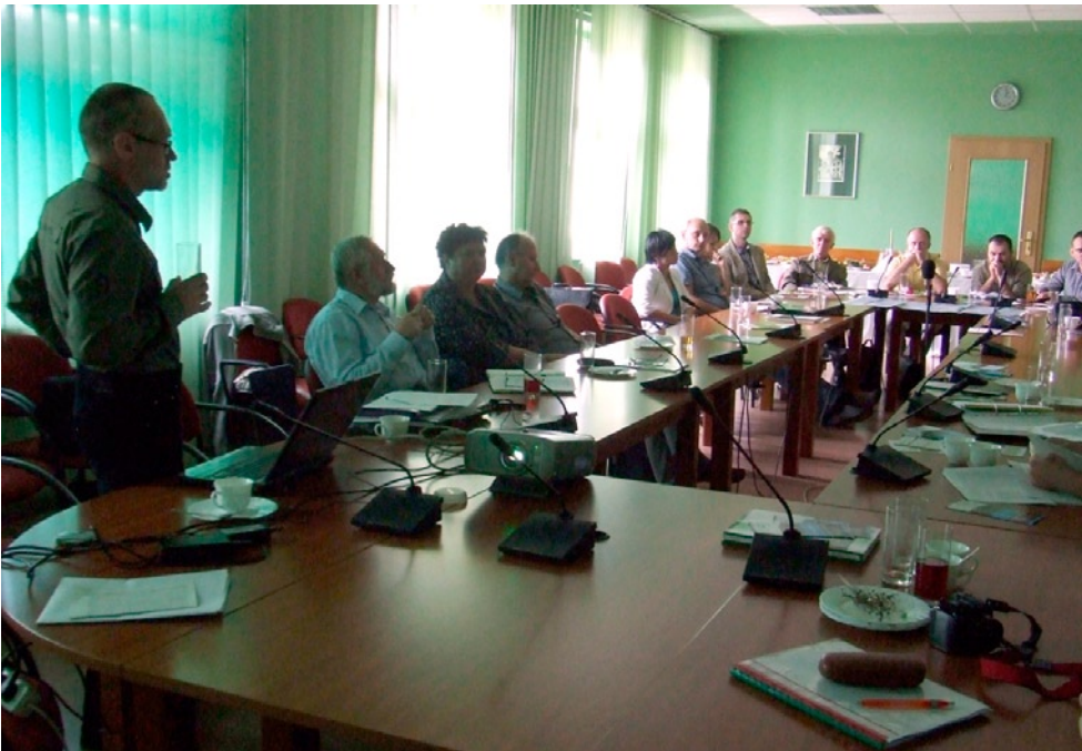
Fot. 4. Spotkanie zespołu lokalnej współpracy, Nowosolska Dolina Odry, rok 2011.

W latach 2010-2015 Klub Przyrodników, na zlecenie różnych podmiotów lub w ramach własnych projektów, sporządził 57 projektów planów ochrony i planów zadań ochronnych (ryc. 1), w tym 7 planów zadań ochronnych dla obszarów „ptasich”, 1 plan ochrony dla części obszaru „ptasiego”, 1 plan ochrony dla obszaru „ptasiego” i „siedliskowego” oraz 48 planów zadań ochronnych dla obszarów „siedliskowych” (Jermaczek 2010a, 2011a-g, 2013b, c, 2014a-c, 2015a-e, Pawlaczyk 2011a, b, 2014, 2015, Stańko 2011a-c, Stańko et al. 2012a-d, 2013a-d, 2015a-d, 2014a-c, Jarzomkowski et al. 2013, 2014, Stańko i Pluciński 2013, Stańko, Horabik i Kwaśny 2013a, b, Stańko, Kiaszewicz i Kwaśny 2013, Barańska, Cwener i Chmielewski 2014a-d, Jermaczek et al. 2014, Jermaczek i Stańko 2014, Michalczuk et al. 2014a, b, Pawlaczyk et al. 2014a, b). Ponadto, Klub był współwykonawcą dwóch planów ochrony