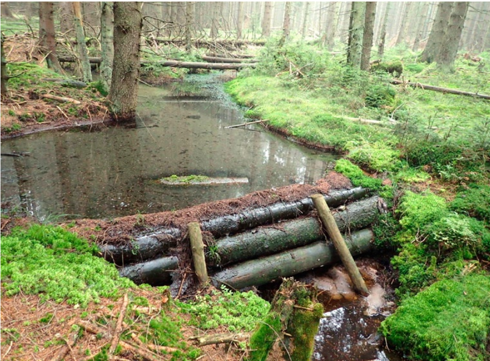
Fot. 2. Blokowanie odpływu wody z torfowisk w Parku Narodowym Gór Stołowych za pomocą pni świerków wyciętych w ramach działań ochronnych. Działanie realizowane w ramach projektu „Ochrona i odtwarzanie zagrożonych siedlisk hydrogenicznych w Sudetach Środkowych”.

Ochrony siedlisk Natura 2000 w górach, głównie torfowisk przejściowych (7140), dotyczył projekt „ Ochrona i odtwarzanie zagrożonych siedlisk hydrogenicznych w Sudetach Środkowych ”. W warunkach górskich jedyną skuteczną metodą zablokowania nadmiernego odpływu wody było zaplanowanie i stworzenie dużej ilości mikroprzeszkód. Do ich budowy wykorzystano surowiec drzewny pozyskany na miejscu, w ramach wykonywanych zabiegów usuwania nalotów drzew (fot. 2). W przypadku siedlisk