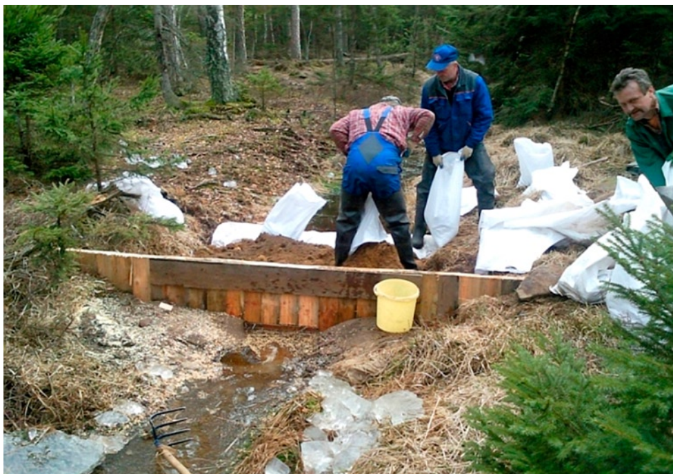
Fot. 1. Zablockowanie rowu odpływającego na jednym z obiektów w ramach projektu „Ochrona wysokich torfowisk bałtyckich na Pomorzu”. Przegrody są zbudowane z 2 ścianek szczelnych, wypełnionych gliną, a powierzchnię nakryto miejscowym torfem. Takie właśnie konstrukcje okazują się jak dotąd najskuteczniejsze, najsolidniejsze i najtrwalsze

W kolejnych latach Klub Przyrodników kontynuował ochronę wysokich torfowisk bałtyckich na Pomorzu. Działaniami objęto 14 najcenniejszych torfowisk bałtyckich, na których zablokowano odpływ wody poprzez odcinkowe zasypywanie zbędnych rowów (fot. 1), usunięto drzewa lub ich odrośla z łącznej powierzchni około 120 ha. Ponadto zbudowano trwały system monitoringu poziomu wody w torfowiskach, który umożliwił precyzyjne dostosowanie urządzeń piętrzących do potrzeb ekosystemów.