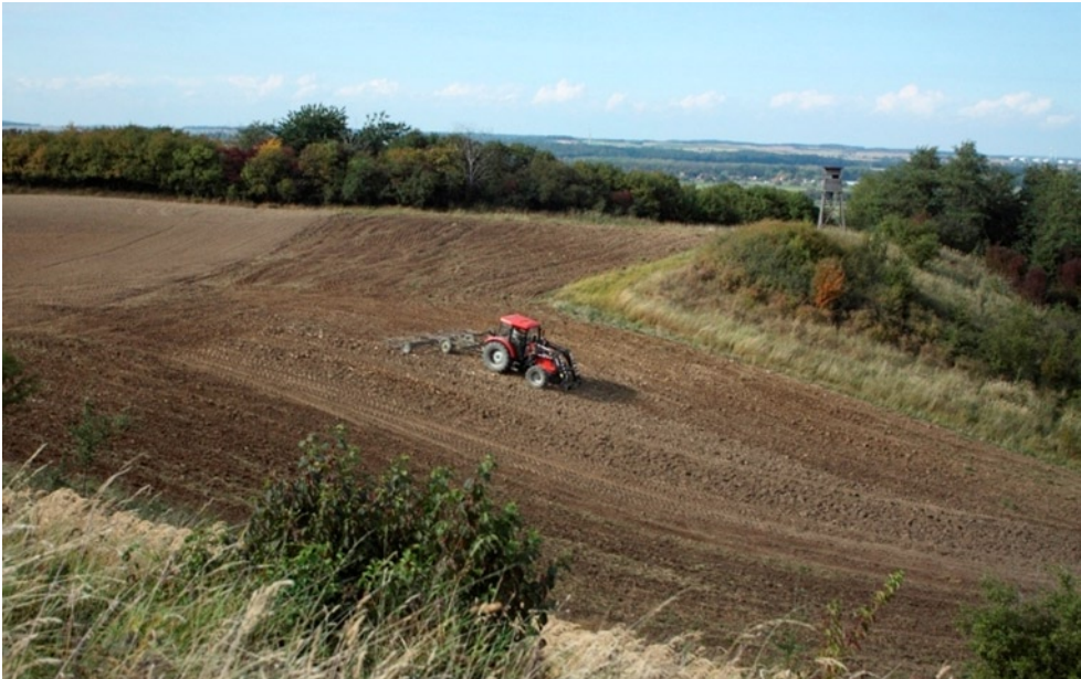
Fot. 3. Bronowanie powierzchni odtwarzanej murawy w Zatonii Dolnej w ramach projektu „Ochrona muraw kserotermicznych w Polsce – teoria i praktyka”.

Informacje o realizowanych przez Klub Przyrodników projektach dotyczących ochrony siedlisk przyrodniczych lub gatunków w obszarach Natura 2000 zawiera tabela.