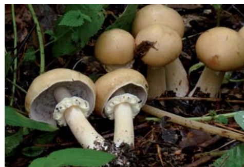
Fot. 19. Łysiczka trocinowa Psilocybe rugosoan- nulata , ID: 174684. Fot. 19. Psilocybe rugosoannulata , ID: 174684.

1. Radomsko-Martelicha, pow. radomszczań- ski, LD, DE-56; 29.08.2010; zadrzewienie (drzewa liściaste); sterta trocin; JN; fot., zieln. (ZBŚRiL PAN, 15/JN/28.12.10); ID: 174684.