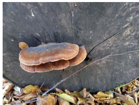
Fot. 12. Smolucha bukowa Ischnoderma resinosum , ID: 178637.

4. Sopot, pow. Sopot, PM, rez. Zajęcze Wzgórze, TPK, DA-70; 18.04.2008; las mieszany; leżące buki; MWR; fot., zieln. (ZBŚRiL PAN, 5/MWR/8.11.10); ID: 97844.