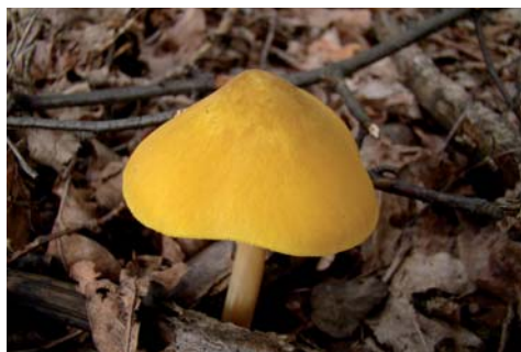
Fot. 17. Drobnoluszcak żółtawy Pluteus leoninus , ID: 144996. Fot. 17. Pluteus leoninus , ID: 144996.

6. Bobry, 1 km W, pow. radomszczański, LD, DE-55; 13.09.2009; przydroże; stara sterka chrustu; JN; fot., zieln. (ZBŚRiL PAN, 2/JN/20.12.10); ID: 144996.