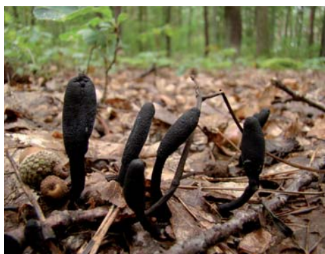
Fot. 2. Maczuznik nasięźrzałowy Cordyceps ophioglossoides , ID: 144126.

4. Tomaszów, 0,8 km N, pow. radomszczański, LD, DE-45; 04.09.2009; las mieszany; owocniki Elaphomyces sp.; JN; fot., zieln. (ZBŚRiL PAN, 14/JN/18.08.10); ID: 144126.