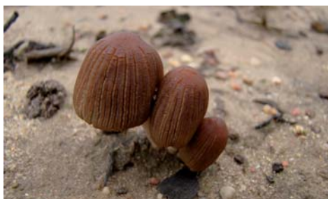
Fot. 7. Czernidłak kanciaszozarodnikowy Coprinus angulatus , ID: 156550.

1. Stobiecko Szlacheckie, żwirownia „KO-SMIN”, pow. radomszczański, LD, DE-45; 24.10.2009; obrzeża żwirowni; kawałki drewna; JN; BG; fot., zieln. (BGF/BF/091024/0001); ID: 156550.