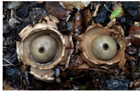
Fot. 10. Gwiazdosz potrójny Geastrum triplex , ID: 172639.

2. Gdańsk-Oliwa, Dolina Zajęcza, teren szpitala dziecięcego, pow. Gdańsk, PM, TPK, DA-80; 05.09.2010; las mieszany; ziemia; MWR; fot.; ID: 172639.