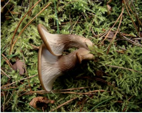
Fot. 11. Bocznianka naziemna Hohenbuehelia geogenia , ID: 170332. Fot. 11. Hohenbuehelia geogenia , ID: 170332.

gałąź; MWR; AK; fot., zieln. (ZBŚRiL PAN, 3/MWR/16.11.10); ID: 170106.