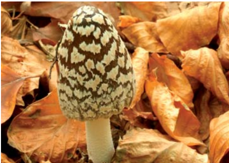
Fot. 8. Czernidłak pstry Coprinus picaceus , ID: 177849. Fot. Barbara Kudławiec

1. Nienawiszcz, 1,3 km SW, pow. obornicki, WP, N2000 „Buczyna w Długiej Goślinie”, Nadl. Łopuchówko, leśn. Buczyna, oddz. 98, BC-79; 07.10.2010; buczyna; ziemia; BK; fot., zieln. (ZBŚRiL PAN, 9/BK/8.12.10); ID: 177849.