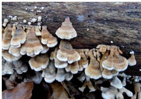
Fot. 16. Fałdówka kędzierzawa Plicatura crispa , ID: 178390. Fot. 16. Plicatura crispa , ID: 178390.

Bory Tucholskie, CB-24; 14.08.2010; las mieszany; szczątki drewna; MiWR; fot., zieln. (ZBŚRiL PAN, 8/MWR/9.12.10); ID: 170558.