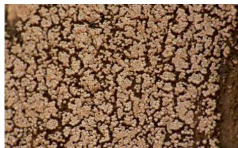
Fot. 14. Osiećka nierówna Merismodes anomalus , ID: 178968.

1. Nienawiszcz, około 1 km W, pow. obornicki, WP, N2000 „Buczyna w Długiej Goślinie”, Nadl. Łopuchówko, leśn. Buczyna, oddz.95, BC-79; 27.12.2009; buczyna; pień buka; BK; fot., zieln. (ZBŚRiL PAN, 6/BK/8.12.10); ID: 178968.