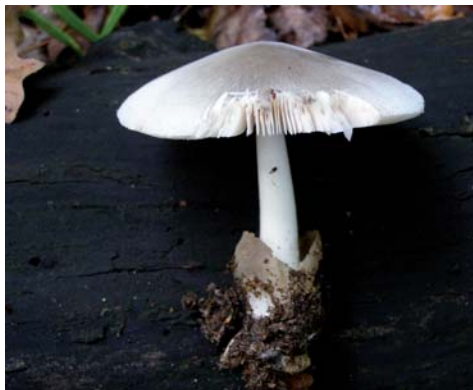
Fot. 20. Volvariella caesiointincta , ID: 114352. Fot. 20. Volvariella caesiointincta , ID: 114352.