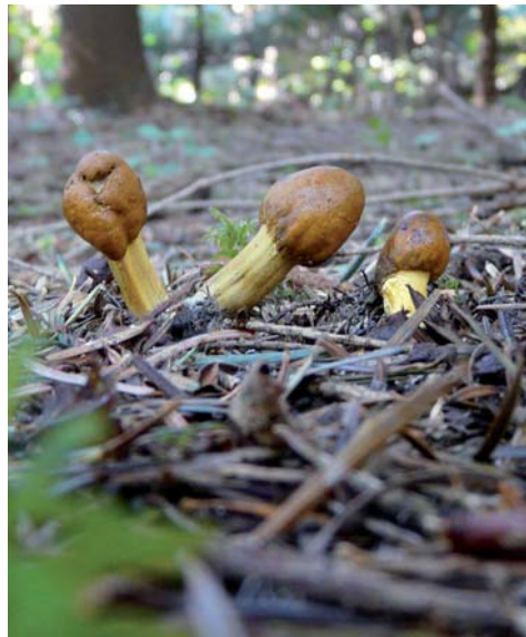
Fot. 1. Maczuźnik główkowaty Cordyceps capitata , ID: 176347.

2. Barniewice k/Gdańska, pow. gdański, PM, CA-89; 21.09.2008; łąka, larwy w zie-