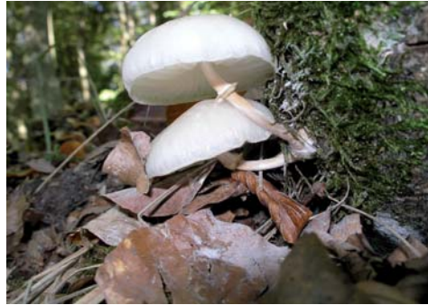
Fot. 15. Monetka bukowa Oudemansiella mucida , ID: 44006.