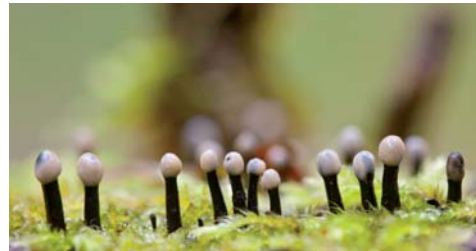
Fot. 3. Lipnik lepki Holwaya mucida , ID: 173571.

1. Białowieża, pow. hajnowski, PD, Obszar Ochrony Ścisłej BPN, GC-55; 12.09.2010; grąd; pień lipy; KZ; MS; fot., ID: 173571.