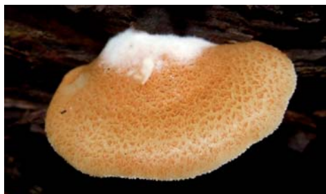
Fot. 9. Ciżmówka miękka odmiana drobnołuskowa Crepidotus mollis var. calolepis , ID: 139133. Fot. Grażyna Domian

2. Szczecin, 1,8 km SE od wiaduktu autostrady nad ul. Kozią, pow. Szczecin, ZP, SPK-PB, N2000 Wzgórza Bukowe, AB-94; 26.06.2009; buczna pomorska; pień osiki; GD; fot., zieln. (ZBŚRiL PAN, 4/GD/29.12.10); ID: 139133.