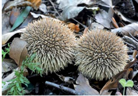
Fot. 13. Purchawka jeżowata Lycoperdon echinatum , ID: 171266.

3. Gdańsk-Oliwa, okolice Drogi Brzozowej, pow. Gdańsk, PM, TPK, DA-80; 03.09.2010; las mieszany; ziemia; MWR; fot., zieln. (ZBŚRiL PAN, 4/MWR/14.12.10); ID: 173699.