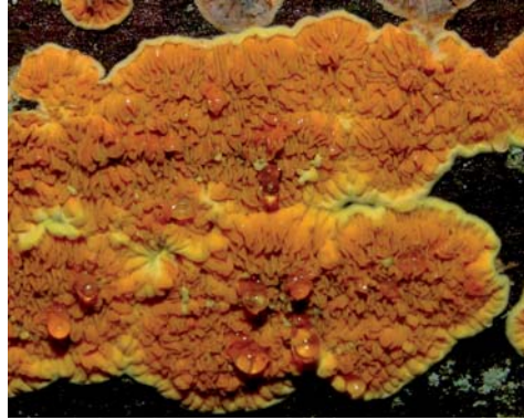
Fot. 18. Stroczniczek złotawy Pseudomerulius aureus , ID: 155606.

1. Semidarżno, około 2 km SE, pow. gryficki, ZP, rez. Mszar koło Semidarżna, Nadl. Gryfice, oddz. 116, AB-19; 30.11.2009; bór bagieny; murszejące kłody sosnowe; GD; fot., zieln. (ZBŚRiL PAN, 12/GD/8.09.10); ID: 155606.