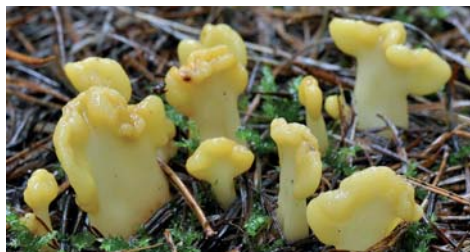
Fot. 4. Łopatnica żółtawa Spathularia flavida , ID: 169490.

6. Otulina rez. Cisy w Serednicy, pow. leski, PK, FG-28; 28.08.2006; drągowina modrzewiowa, ziemia; PCH; fot., zieln. (ZBŚRiL PAN, 32/PC/3.07.08); ID: 40205