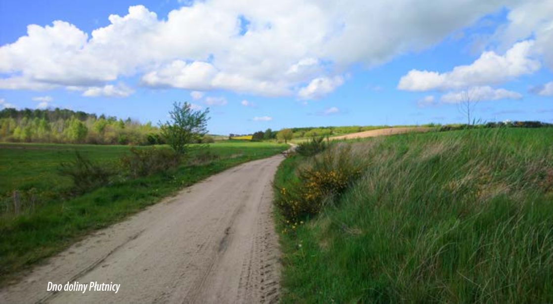
Dno doliny Płutnicy

spójne z prowadzonym obecnie audytem krajobrazowym województwa, co daje szansę na kompleksowe uchwycenie problematyki ochrony przyrody, walorów kulturowych i krajobrazu (czyli urzeczywistnienie idei trójochrony).