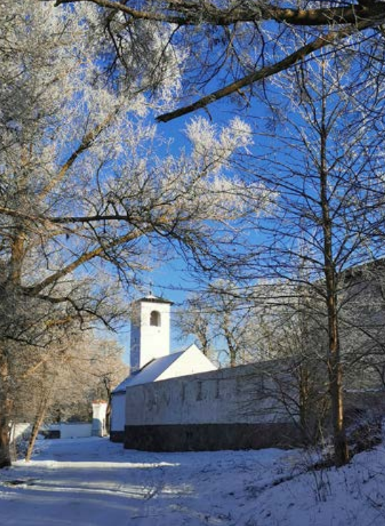
Pozostałości zabudowań po folwarku Cysterów w Starzyńskim Dworze

istotna ze względu na współodpowiedzialność samorządów lokalnych za prawidłowe i zrównoważone funkcjonowanie tych obszarów. To gmina, realizując na swoim terenie politykę przestrzenną, wpływa bezpośrednio na stopień zainwestowania tych obszarów, jak i ochronę najcenniejszych jego elementów. Prowadzone konsultacje mają również wymiar edukacyjny – z jednej strony samorząd województwa wskazuje gminie potencjał, jaki posiadają poszczególne obszary chronione, z drugiej zaś dostarcza szczegółową dokumentację wraz z materiałem fotograficznym, kartograficznym i filmowym.