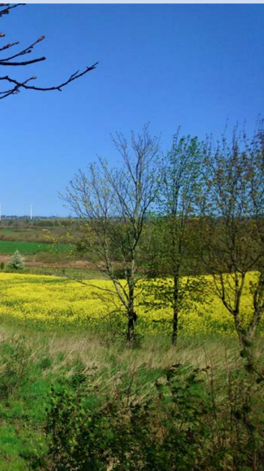
Widok na dolinę rzeki Płutnicy

31 sierpnia 2021 r. weszła w życie uchwała Sejmiku Województwa Pomorskiego powołująca nowy Obszar Chronionego Krajobrazu Doliny Rzeki Płutnicy. Jest to już 46 obszar chronionego krajobrazu w granicach województwa.