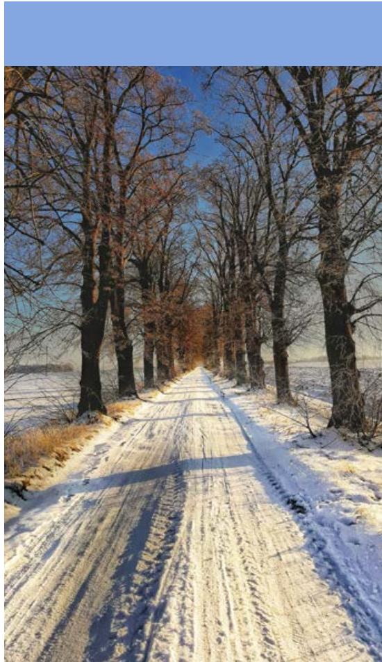
Aleja lipowa w Starzyńskim Dworze