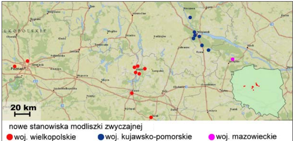
Ryc. 1. Nowe stanowiska modliszki zwyczajnej Mantis religiosa w Polsce.