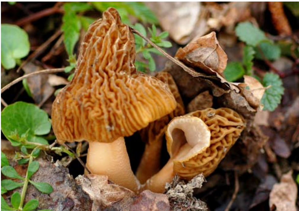
Fot. 3. Smardzówka czeska ( Verpa bohemica ), ID: 95428.

SK, EF-14; 28.04.2008; ogród, rabaty; ziemia; ZO; fot.; ID: 102571. 4. Tarnów, pow. Tarnów, MP, EF-66; 08.04.2008; tereny ruderalne, młode zadrzewienie; ziemia; MCz; TP; fot.; ID: 96900. 5. dol. rz. Raby, pow. wielicki, MP, EF-82; 21.03.2008; las łęgowy; ziemia; APK; fot., zieln. (ZBŚRiL PAN, 1/APK/7.04.08); ID: 95428 (Fot. 3.). 6. Folwark, pow. limanowski, MP, EF-92; 20.04.2008; przy korycie rzeki; ziemia; APK; fot.; ID: 97858. 7. Stalowa Wola, 2 km W, pow. stalowowolski, PK, FE-94; 07.04.2008; las liściasty; ziemia; WS; fot.; ID: 96499. 8. Stalowa Wola, 1 km E, nad rz. San, pow. stalowowolski, PK, FF-04; 06.04.2008; las łęgowy; ziemia; WS; fot., zieln. (ZBŚRiL PAN, 6/WS/26.04.08); ID: 96457. 9. Stalowa Wola, pow. stalowowolski, PK, FF-05; 18.04.2008; las łęgowy; ziemia; WS; fot.; ID: 97689. 10. Tylawa, pow. krośnieński, PK, FG-22; 13.04.2008; nad rzeką; ziemia; AH; fot.; ID: 97329. 11. Wola Niżna, okolice nieistniejącej wsi Polany Surowiczne, u podnóża G. Polańskiej, pow. krośnieński, PK, FG-23;