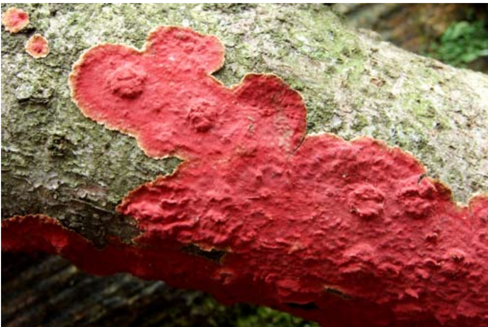
Fot. 7. Szczeciniak jodłowy ( Hymenochaete cruenta ), ID: 95121. Fot. Zygmunt Augustowski

MP, EG-29; 25.02.2008; las bukowo-jodłowy; konary jodły; ZA; fot., zieln. (ZA, <080225 Hymenochaete cruenta >); ID: 94422. 3. Wołowiec, S podnóże g. Mareszki, pow. gorlicki, MP, EG-29; 08.03.2008; grupa starych jodeł w wąwozie strumienia; gałęzie jodły; ZA; fot., zieln. (ZA, <080208 Hymenochaete cruenta >); ID: 95121 (Fot. 7.). 4. Wołowiec, 2 km SE, pow. gorlicki, MP, FG-20; 01.03.2008; las bukowo-jodłowy; konary jodły; ZA; fot., zieln. (ZA, <080301 Hymenochaete cruenta >); ID: 94426. 5. Wola Niżna, 3 km NE, pow. krośnieński, PK, FG-33; 17.07.2008; las świerkowy; gałąź; TP; zieln. (ZBŚRiL PAN, 4/TP/21.12.08); ID: 122927. 6. Wola Niżna, pow. krośnieński, PK, FG-33; 13.04.2008; las mieszany; gałęzie jodły; AH; fot., zieln. (ZBŚRiL PAN, 2/AH/16.05.08); ID: 97550. 7. kilka km N od m. Wisłok Wielki i Czystogarb, pow. sanocki, PK, FG-35; 30.03.2008; las mieszany; pień jodły; AH; fot., zieln. (ZBŚRiL PAN, 2/AH/3.04.08); ID: 96168.