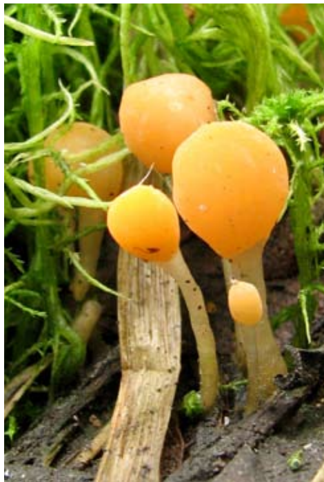
Fot. 2. Mitróweczka błotna ( Mitrula paludosa ), ID: 111465.

1. Szklarska Poręba Górna 1 km S, pow. jeleniogórski, DS, AE-78; 27.09.2008; las bukowo-świerkowy; ziemia; TP; BG; fot., zieln. (ZBŚRiL PAN, 19/TP/28.02.09 & 2/TP/22.12.08); ID:122931.