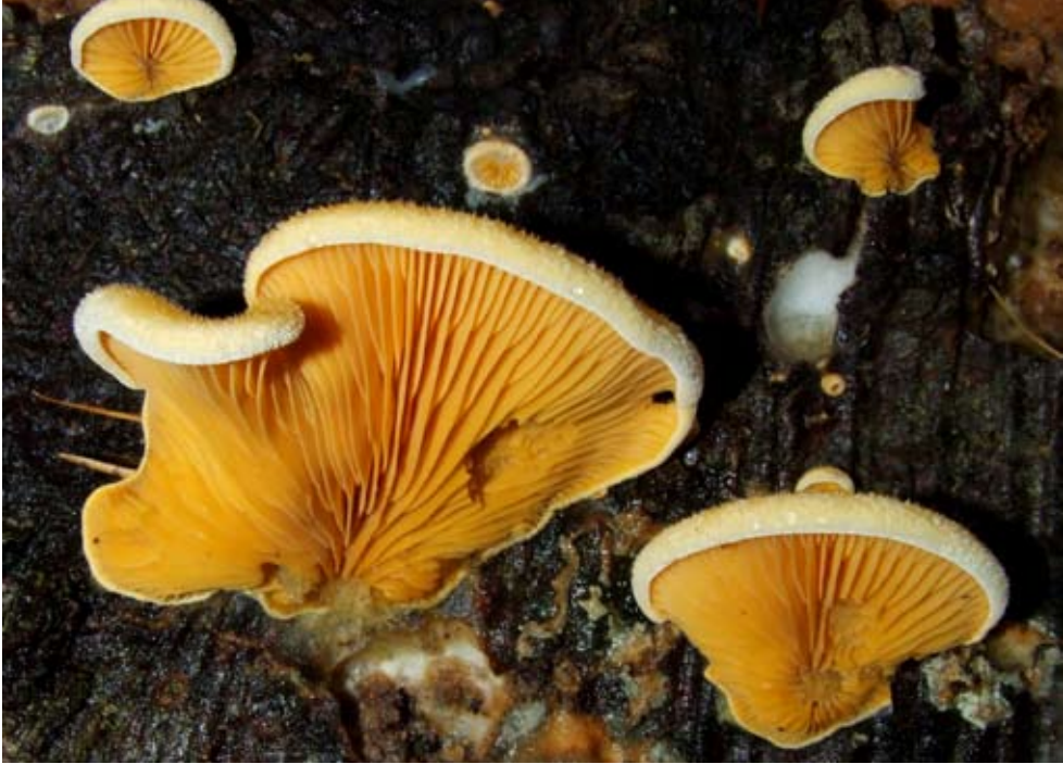
Fot. 9. Boczniaczek pomarańczowożółty ( Phyllotopsis nidulans ), ID: 122622.

7 km NE, pow. Tychy, SL, DF-53; 24.10.2008; las mieszany; kłody bukowe; JG; fot., zieln. (ZBŚRiL PAN, 2/JG/18.12.08); ID: 121025. 3. Huta Wysowska, NE stok Ostrego Wierchu, pow. gorlicki, MP, EG-38; 10.10.2008; las bukowy; kłoda świerka; ZA; fot., zieln. (ZA, <081010 Phyllotopsis nidulans >); ID: 122142. 4. Wołowiec, 2 km SE, pow. gorlicki, MP, FG-20; 01.03.2008; las bukowo-jodłowy; pień jodły; ZA; fot., zieln. (ZA, <080301 Phyllotopsis nidulans >); ID: 94425.