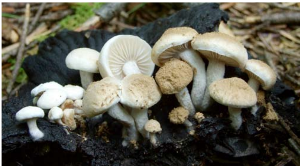
Fot. 4. Grzybolubka purchawkowata ( Asterophora lycoperdoides ), ID: 122049.

1. Szklarska Poręba Górna, S kraniec miasta, pow. jeleniogórski, DS, AE-78; 30.09.2008; las świerkowo-bukowy; owocniki Russula sp.; TP; AK; fot., zieln. (ZBŚRiL PAN, 11/ TP/22.12.08); ID: 122913. 2. Wołowiec, 2 km S, pow. gorlicki, MP, FG-20; 18.08.2008 & 28.08.2008; las bukowo-jodłowy; owoc- niki Russula sp. lub Lactarius sp.; ZA; fot., zieln. (ZA, <080818 Asterophora parasitica >