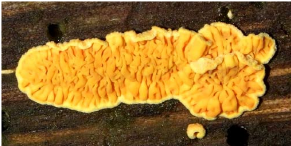
Fot. 12. Stroczniczek złotawy ( Pseudomerulius aureus ), ID: 119788.

kłoda sosny; GD; fot., zieln. (ZBŚRiL PAN, 14/GD/29.12.08); ID: 119788 (Fot. 12.). 2. Biesowice, 2 km E, pow. słupski, PM, BB-09; 24.08.2008; las sosnowy; niezidentyfikowana gałąź; JG; fot., zieln. (ZBŚRiL PAN, 11/JG/17.12.08); ID: 120902. 3. Żaby, 1 km N, pow. radomszczański, LD, DE-45; 22.10.2008 & 07.12.2008; las mieszany; gałąź sosny i kłoda świerka; JN; fot., zieln. (ZBŚRiL PAN, 10/JN/13.12.08 & 6/JN/16.12.08); ID: 119341 & 122302. 4. Kol. Brudzice, 1 km N, pow. radomszczański, LD, DE-45; 05.10.2008; las mieszany; gałąź drzewa iglastego; JN; fot., zieln. (ZBŚRiL PAN, 8/JN/16.12.08); ID: 121477. 5. Tomaszów, 1 km N, pow. radomszczański, LD, DE-55; 21.11.2008; las mieszany; gałąź sosny; JN; fot., zieln. (ZBŚRiL PAN, 10/JN/16.12.08); ID: 121473. 6. Bobry, 1,5 km SW, pow. radomszczański, LD, DE-55; 06.12.2008; las mieszany; gałąź sosny; JN; fot., zieln. (ZBŚRiL PAN, 1/JN/17.12.08); ID: 122218. 7. Kłomnice, pow. częstochowski, SL, DE-65; 06.12.2008; las mieszany; gałąź sosny; KKo; fot., zieln. (ZBŚRiL PAN, 12/KK/22.03.09); ID: 123113. 8. Michałopol, 2 km SW, pow. radomszczański, LD, DE-76; 21.10.2008; las świerkowo-sosnowy; gałąź sosny; JN; fot., zieln. (ZBŚRiL PAN, 16/JN/13.12.08); ID: 119248. 9. Błachownia, otulina PK „Lasy nad