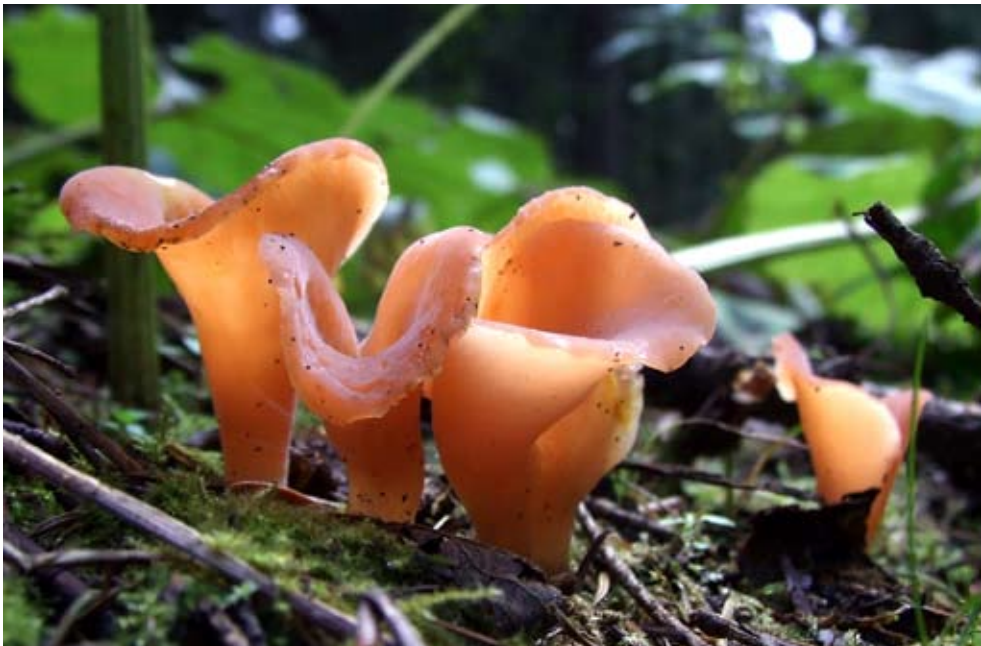
Fot. 15. Płomykowiec galaretowaty ( Tremiscus helvelloides ), ID: 118262.

1. Lubogóra, 0,5 km NW, pow. świebodziński, LS, AD-28; 13.10.2007; las mieszany; ziemia; TŚ; fot., zieln. (TŚ, H. 870); ID: 84120. 2. Promnice, pow. pszczyński, SL, DF-62; 16.10.2008; skarpa porośnięta osiką, dębem, brzozą i wierzbą; ziemia; JG; fot., zieln. (ZBŚRiL PAN, 7/JG/17.12.08); ID: 120947.