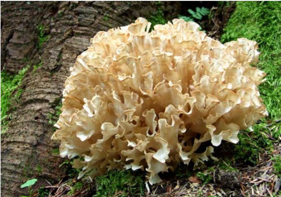
Fot. 13. Siedziun dębowy ( Sparassis brevipes ), ID 1122139.

1. Szczecin, Cmentarz Centralny, pow. Szczecin, ZP, AB-83; 23.09.2008; park; nasady pni daglezi zielonych; PP; fot.; ID: 116239. 2. 0,8 km SE od węzła autostrady przy ul. Morwowej w Szczecinie Podjuchach, pow. gryfiński, ZP, AB-83; 31.10.2008; buczyna pomorska; pniak sosny lub modrzewia; GD; fot.; ID: