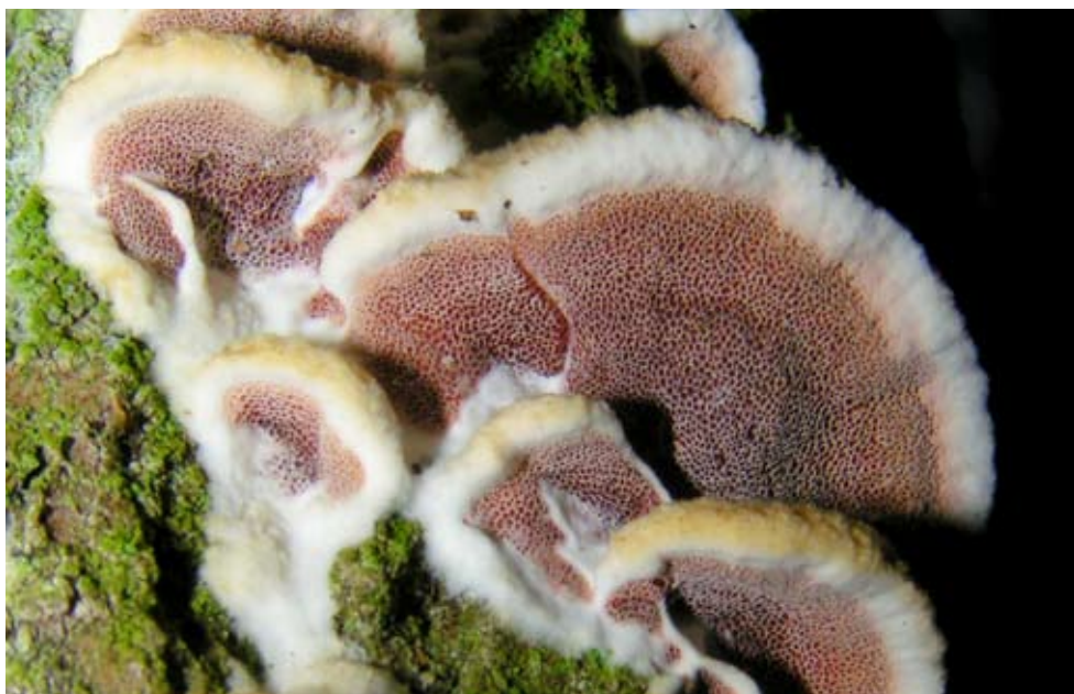
Fot. 5. Klejoperek dwubarwny ( Gleoporus dichrous ), ID: 112337.

1. Bąkowo, pow. gdański, PM, CA-99; 09.03.2008; las bukowy; gałąź sosny; MWR, WM; fot., zieln. (ZBŚRiL PAN, 4/WM/6.04.08); ID: 95785. 2. Borowa, 1,5 km NE; pow. radomszczański, LD, DE-35; 07.12.2008; las mieszany; pień sosny; JN; fot., zieln. (ZBŚRiL PAN, 1/JN/16.05.09); ID: 122292. 3. Józefów Północny, 1 km N & 0,5 km NE, pow. radomszczański, LD, DE-47; 24.10.2008; skraj stawu śródleśnego i młodnik; pień sosny; JN; fot., zieln. (ZBŚRiL PAN, 16/JN/9.05.09 & 3/JN/16.05.09); ID: 119478 & 119481. 4. Klekowiec, 0,7 km NW, pow. radomszczański, LD, DE-56; 30.03.2008; starodrzew sosnowy; gałąź sosny; JN; DK; fot., zieln. (ZBŚRiL PAN, 13/JN/30.05.08); ID: 100237. 5. Kłomnice, pow. częstochowski, SL, DE-65 & DE-75; 04.11.2007, 09.03.2008 & 14.12.2008; las mieszany; gałąź sosny; KKo; fot., zieln. (ZBŚRiL PAN, 2/KK/26.04.08, 2/