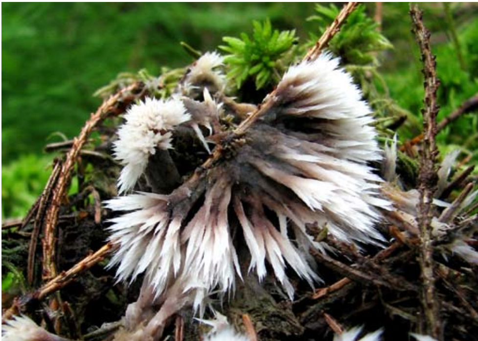
Fot. 14. Chropiatka pędzelkowata ( Thelephora penicillata ), ID: 111534.

fot., zieln. (ZBŚRiL PAN, 7/GD/18.10.08, 9/GD/30.08.08 & 10/GD/30.08.08); ID: 112223, 110644 & 110647. 2. Dobropole Gryfińskie, 1,6 i 1,7 km E, pow. gryfiński, ZP, AB-94; 02.11.2007 & 22.01.2008; buczyna pomorska; drewno buka i pień brzozy; GD; fot., zieln. (ZBŚRiL PAN, 2/GD/20.10.08 & 9/GD/26.09.08); ID: 112650 & 111860. 3. Glinna, 0,4 km SE, pow. gryfiński, ZP, AB-94; 14.02.2007; ols; gałąź olszy; GD; fot., zieln. (ZBŚRiL PAN, 17/GD/30.08.08); ID: 110658. 4. Kołowo, 2,2 km SE, pow. gryfiński, ZP, AB-94; 20.10.2007; buczyna pomorska; gałąź buka; GD; fot., zieln. (ZBŚRiL PAN, 3/GD/26.09.08); ID: 111717. 5. Kołowo, 2,1 km NE, pow. gryfiński, ZP, AB-94; 01.11.2008; buczyna pomorska; konar buka; GD; fot., zieln. (ZBŚRiL PAN, 23/GD/29.12.08); ID: 120013. 6. 0,6 km SE od skrzyżowania rz. Płoni i drogi krajowej nr 10, pow. Szczecin, ZP, AB-94; 09.11.2008; ols; kłoda olszy; GD; fot., zieln. (ZBŚRiL PAN, 23/GD/20.12.08); ID: 121922. 7. Szklarska Poręba Górna, 1 km