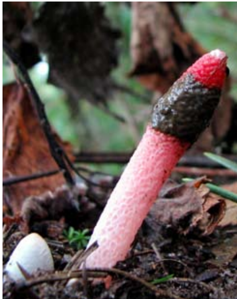
Fot. 8. Mądziak malinowy ( Mutinus ravenelii ), ID: 120913.

pow. krośnieński, PK, FG-33; 30.09.2007; las mieszany; ziemia; AH; fot., zieln. (ZBŚRiL PAN, 4/AH/3.07.08); ID: 80530.