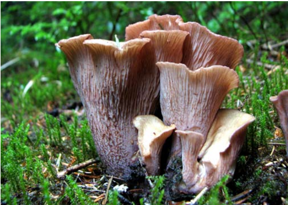
Fot. 16. Siatkoblaszek maczugowaty ( Gomphus clavatus ), ID: 107955.

Wśród przyjętych do rejestru w roku 2008 taksonów, 10 nie jest wymieniona na krytycznych listach grzybów Polski (Wojewoda