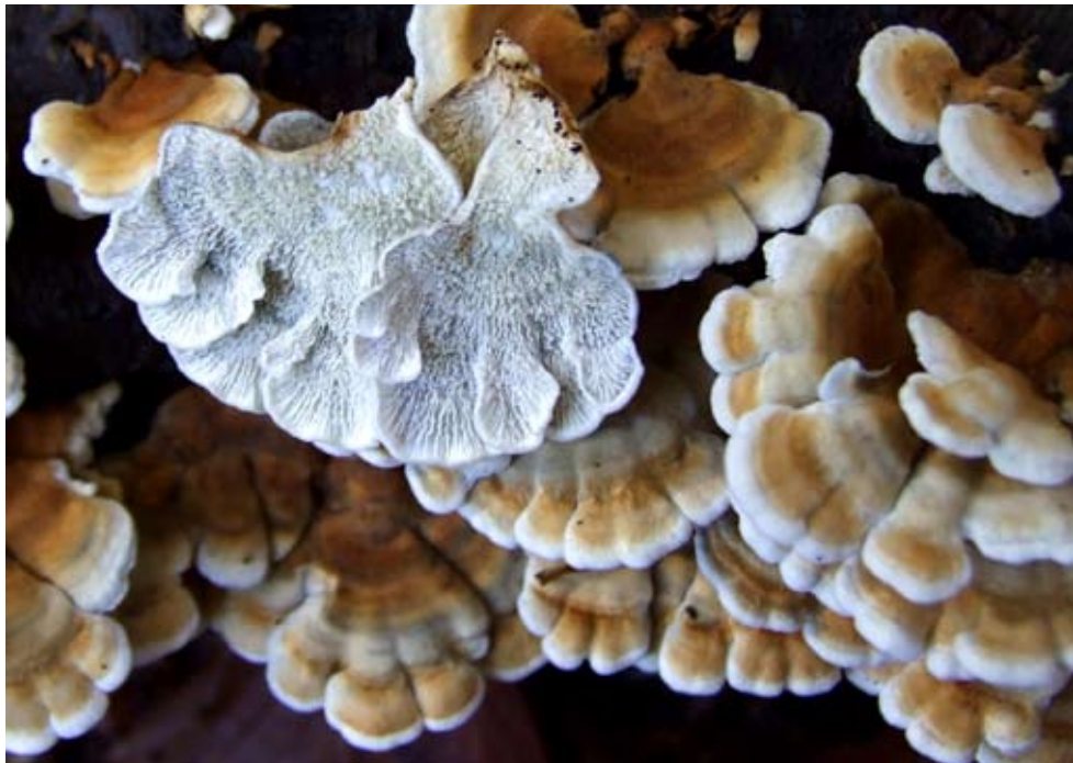
Fot. 11. Fałdówka kędzierzawa ( Plicatura crispa ), ID: 118672.

1. Binowo, 4,2 km NW, pow. gryfiński, ZP, AB-93; 19.01.2008; buczyna pomorska; konar buka; GD; fot., zieln. (ZBŚRiL PAN, 19/GD/18.10.08); ID: 112522. 2. Dobropo-