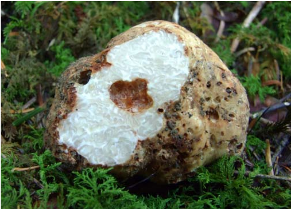
Fot. 1. Piestrak jadalny ( Choiromyces meandriformis ), ID: 122013.

1. Grzebień, pow. radomszczański, LD, DE-56; 06.10.2008; las mieszany; owocnik Elaphomyces sp.; JN; AK; fot., zieln. (ZBŚRiL