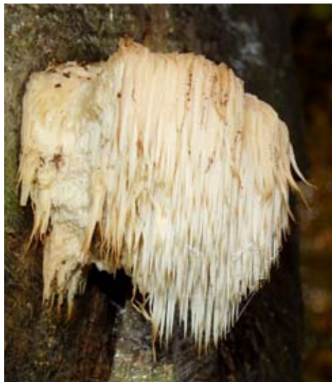
Fot. 6. Soplówka jeżowata ( Hericium erinaceum ). ID: 111857. Fot. Grażyna Domian

1. Dziemiany, pow. kościerski, PM, CB-24; 22.07.2007; bór sosnowy; ziemia; MWR; SP; fot.; ID: 73213.