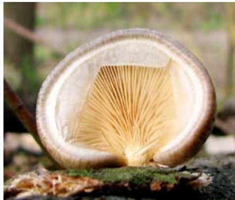
Fot. 10. Bocznik topolowy ( Pleurotus calyptrotus ), ID: 99817.

1. Gryżyna, 1 km NW, pow. krośnieński, LS, AD-27; 07.10.2007; skraj boru sosnowego; ziemia; TŚ; fot., zieln. (TŚ, H. 905); ID: 100595.